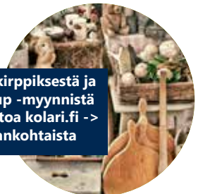
Vilttikirppiksestä ja Pop up -myynnistä lisätietoa kolari.fi -> Ajankohtaista