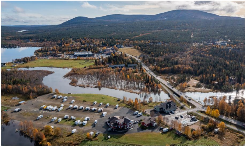
Kuva 2. Syystulvaa Äkäslompolossa syksyllä 2023. Suunnittelualue on lähes kokonaan tulvan alla.