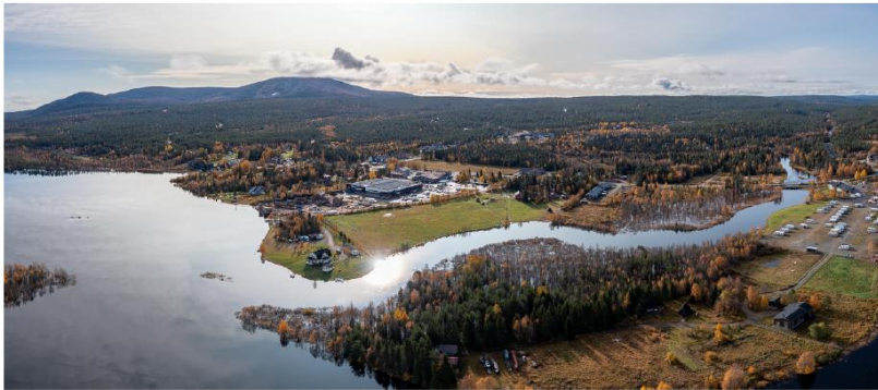
Kuva 3. Syystulvaa Äkäslompolossa syksyllä 2023.