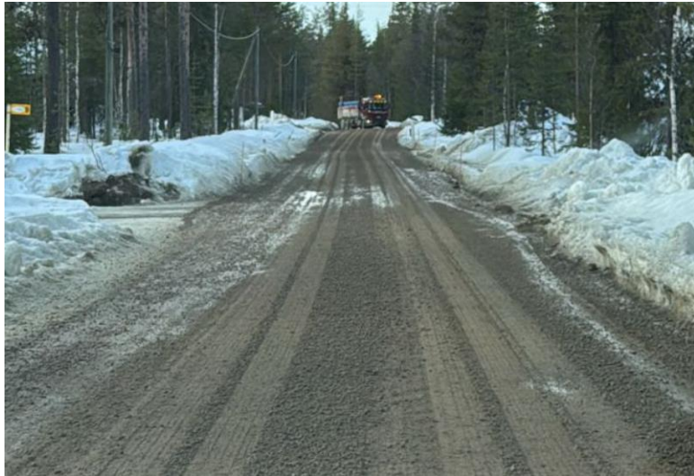
Huollettu tie pari päivää huollon jälkeen sunnuntaina 12.4. iltapäivällä